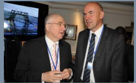
Accueil des participants à l'Africa Security Forum 2015

Ouverture à Casablanca du Forum Africain de la Sécurité Maroc.ma