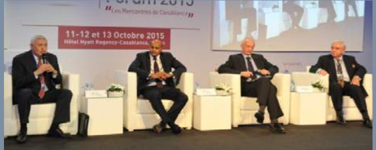
Africa Security Forum 2015