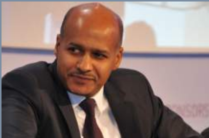
Mohammed Mahmoud Ould Mohamed Ancien Ministre des Affaires Etrangères - Mauritanie

Sécurité en Afrique: des experts échangent leurs expériences