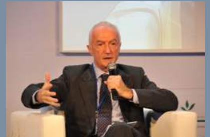
Gilles de Kerchove - Coordinateur de l'EU pour la lutte contre le terrorisme - Belgique