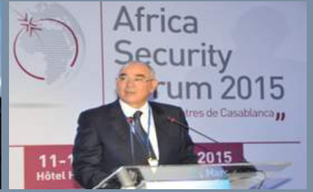
Cherki Draiss Min. Délégué auprès du Min. de l'intérieur-Maroc