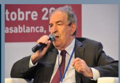
Jean-Louis Bruguière Juge Anti-terroriste auprès du TGI de paris - France