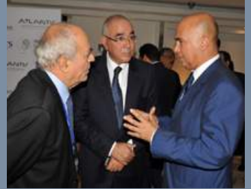
Arrivée du Ministre Délégué auprès du Ministre de l'Intérieur M. Charki Draiss - Maroc